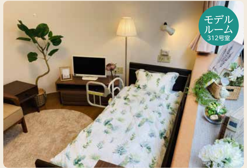
モデル ルーム 312号室