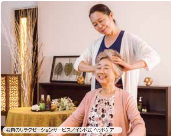
独自のリラクゼーションサービス/インド式ヘッドケア