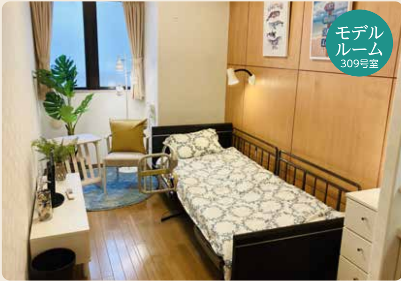
モデル ルーム 309号室