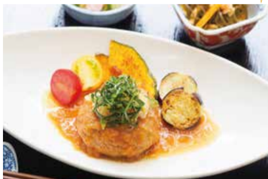
選択制のメニュー