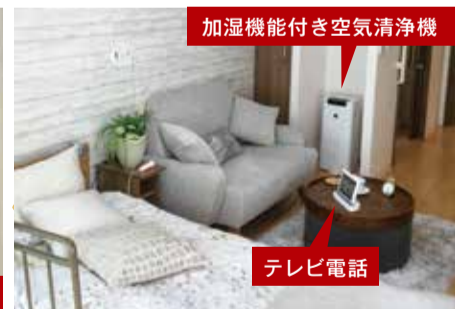
加湿機能付き空気清浄機