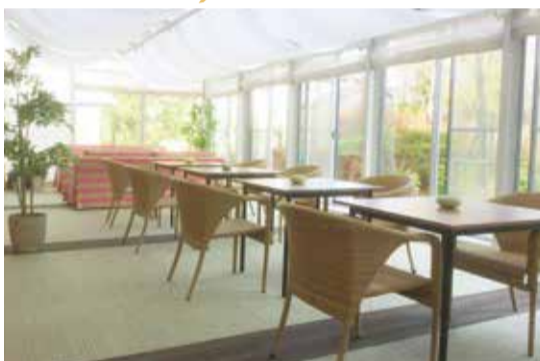
中庭を一望できるラウンジ

◎お二人様用のお部屋もございます。詳しくはお問い合わせください。 ◎クリーニング、リネン交換の料金込み・協力医療機関への送迎無料