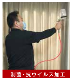
制菌・抗ウイルス加工